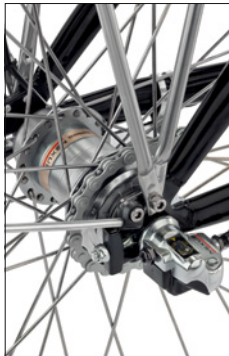
SHIMANO Nexus 3-speed hub (optional)