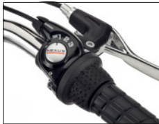
SHIMANO 3-speed gear shift (optional)