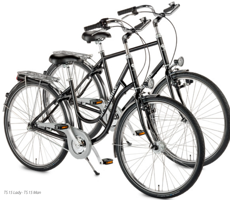
TS 15 Lady - TS 15 Man

TS 15 NEW – the reliable entry-level model redesigned with optimized geometry. Best suited for industry, government and rental the TS 15 is available as a ladies' and gents' version.