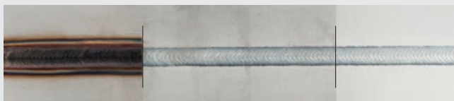
/ CrNi vor Reinigung / nach Reinigung / nach Aufhellen