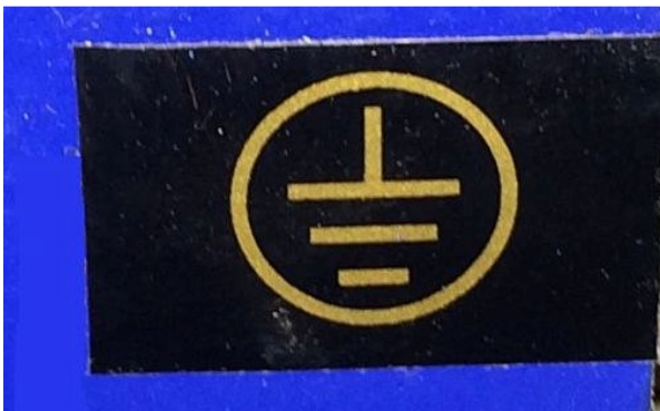
Abbildung 1 Erdung Basis

Weiterhin ist eine Erdung am Trägerbalken (Abbildung 1) der Antriebseinheit anzubringen um das Irrleiten von Schweißströmen über den Schrank zu verhindern, da dies zu Schäden und Betriebsausfällen führen kann!