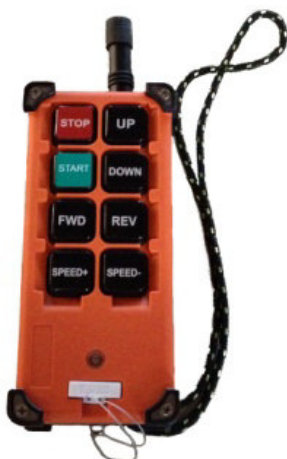
Abbildung 2 Funkfernbedienung