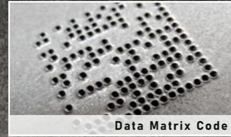
Data Matrix Code