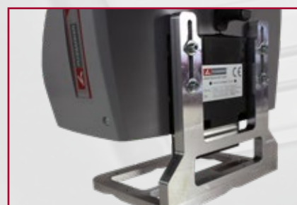
Abnehmbarer Stellwinkel (optional)