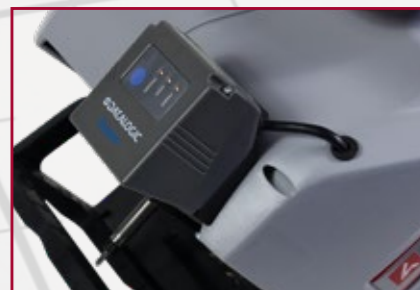
Integrierter Barcodescanner (optional)