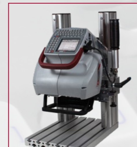
Säulengestell für Kleinteile (optional) (Abb. FlyMarker® mini 120/45)