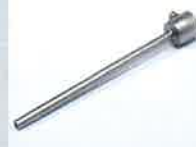
Extension nozzle Ø 5 x 150 mm, straight Article No: 105.567