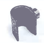
Sieve reflector 50 x 35 mm Article No: 107.311