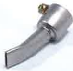
Wide slot nozzle 15 mm Article No: 107.141