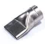
Wide slot nozzle 70 x 10 mm Article No: 107.258