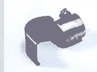
Spoon reflector 25 x 30 mm Article No: 107.312