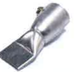
Wide slot nozzle 40 mm Article No: 106.999