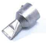
Tape welding nozzle 40 mm Article No: 107.134