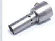
De-horning nozzle Article No: 107.007