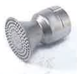
Sieve reflector Ø 65 mm Article No: 106.127