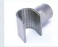
Siebreflektor 50 x 35 mm Artikel-Nr.: 107.308