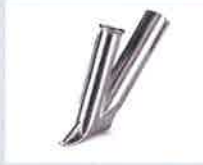
Schnellschweißdüse * Ø: 3 mm 4 mm 5 mm Art.-Nr. 106.989 106.990 106.991