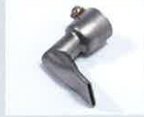
Winkeldüse 20 mm, 90° abgewinkelt Artikel-Nr.: 105.556