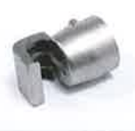
Soldering reflector 17 x 34 mm Article No: 107.325