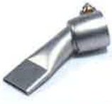
Wide slot nozzle 20 mm Article No: 107.142