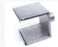
Siebreflektor 150 x 130 mm Artikel-Nr.: 107.333