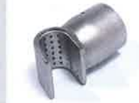
Sieve reflector 35 x 20 mm Article No: 107.309