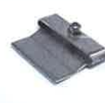
Scraper nozzle, only with heater tube, Article No: 116.053 Article No: 116.054