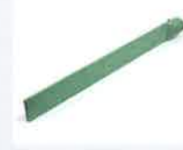
Heizschwert 74 x 12 x 520 mm, Kanten gerundet, PTFE-beschichtet Artikel-Nr.: 107.347