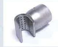
Siebreflektor 35 x 20 mm Artikel-Nr.: 107.309