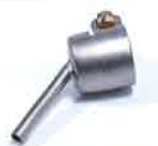
Soldering nozzle Ø 4 mm Article No: 107.151