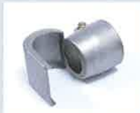
Löffelreflektor 25 x 30 mm Artikel-Nr.: 107.313