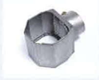
Klappreflektor 60 x 75 mm Artikel-Nr.: 107.328