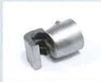
Löffelreflektor 17 x 34 mm Artikel-Nr.: 107.325