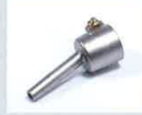
Rohrdüse Ø 5 mm Artikel-Nr.: 107.144