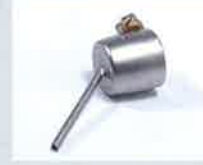
Lötdüse Ø 2 mm Artikel-Nr.: 107.146