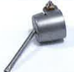
Soldering nozzle Ø 3 x 1.5 mm, oval Article No: 107.148