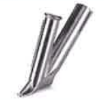
Speed welding nozzle * Ø: 3 mm 4 mm 5 mm Art. No: 106.989 106.990 106.991