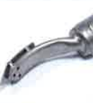
Ironing nozzle 15 x 25 mm Article No: 107.305