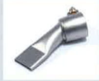
Breitschlitzdüse 20 mm Artikel-Nr.: 107.142