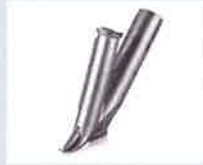
Schnellschweißdüse *, schmaler Luft- schlitz, Ø: 3 mm 4 mm 5 mm Art.-Nr.: 105.431 105.432 105.433