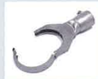
Klappreflektor 70 x 12 mm Artikel-Nr.: 107.315