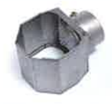
Folding reflector 60 x 75 mm Article No: 107.328