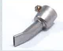
Breitschlitzdüse 15 mm Artikel-Nr.: 107.141