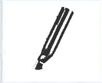
Heißdüse * Artikel-Nr.: 106.996