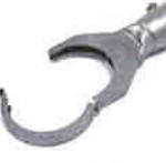
Folding reflector 70 x 12 mm Article No: 107.315