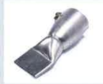
Breitschlitzdüse 40 mm Artikel-Nr.: 106.999