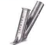
Speed welding nozzle *, triangular shaped 5.7 mm 7 mm Article No: 106.992 106.993