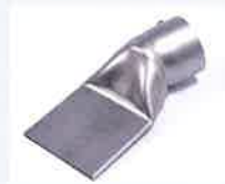
Breitschlitzdüse 75 x 2 mm, geliefert mit Standfuss, Artikel-Nr.: 116.753 Artikel-Nr.: 107.266