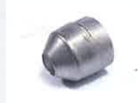
Round nozzle 20 mm Article No: 107.229