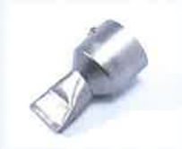
Bandschweißdüse 40 mm Artikel-Nr.: 107.134