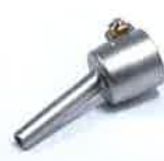
Tubular nozzle Ø 5 mm Article No: 107.144