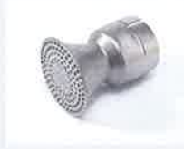
Siebreflektor Ø 65 mm Artikel-Nr.: 106.127