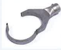
Klappreflektor 125 x 22 mm Artikel-Nr.: 107.330