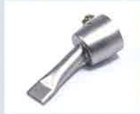
Breitschlitzdüse 20 mm Artikel-Nr.: 106.998