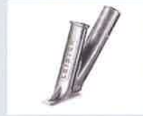
Schnellschweißdüse *, Dreiecksprofil 5,7 mm 7 mm Artikel-Nr.: 106.992 106.993