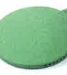
Welding mirror 270 mm, PTFE coated Article No: 107.346