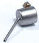
Soldering nozzle Ø 2 mm Article No: 107.146