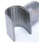
Sieve reflector 50 x 35 mm Article No: 107.308