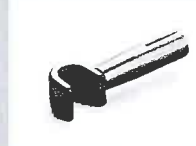
Sieve reflector (Ø 8.25 mm) * 10 x 12 mm Article No: 107.324

use in combination with Ø 5 mm: 107.144 105.567 107.154 107.006