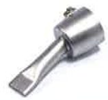
Wide slot nozzle 20 mm Article No: 106.998