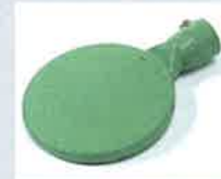
Schweißspiegel 135 mm, PTFE-beschichtet Artikel-Nr.: 107.345