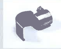
Löffelreflektor 25 x 30 mm Artikel-Nr.: 107.312