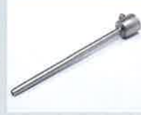
Verlängerungsdüse Ø 5 x 150 mm, gerade Artikel-Nr.: 105.567