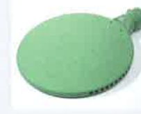
Schweißspiegel 270 mm, PTFE-beschichtet Artikel-Nr.: 107.346