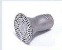
Siebreflektor Ø 65 mm Artikel-Nr.: 107.319