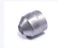
Runddüse 20 mm Artikel-Nr.: 107.229