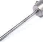
Extension nozzle Ø 5 x 130 mm, straight Article No: 107.006