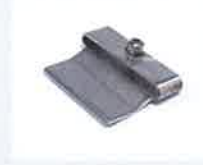
Schaberdüse, nur mit Heizelementrohr, Artikel-Nr.: 116.053 Artikel-Nr.: 116.054