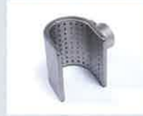
Siebreflektor 50 x 35 mm Artikel-Nr.: 107.311