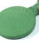
Welding mirror 135 mm, PTFE coated Article No: 107.345