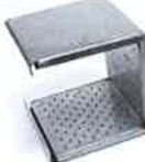
Sieve reflector 150 x 130 mm Article No: 107.333