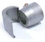
Spoon reflector 25 x 30 mm Article No: 107.313