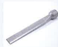
Breitschlitzdüse 45 x 12 x 350 mm Artikel-Nr.: 105.961