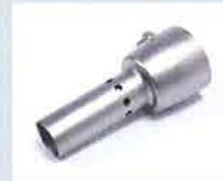
Enthördüse Artikel-Nr.: 107.007