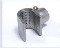
Siebreflektor 20 x 35 mm Artikel-Nr.: 107.310