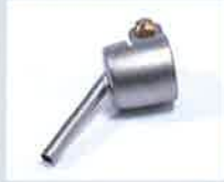
Lötdüse Ø 4 mm Artikel-Nr.: 107.151