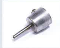
Rohrdüse Ø 5 mm Artikel-Nr.: 107.154