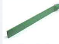
Swordshaped nozzle 74 x 12 x 520 mm, edges rounded, PTFE coated Article No: 107.347