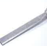
Wide slot nozzle 45 x 12 x 350 mm Article No: 105.961