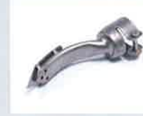
Bügeldüse 15 x 25 mm Artikel-Nr.: 107.305