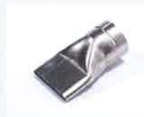
Breitschlitzdüse 70 x 10 mm Artikel-Nr.: 107.258