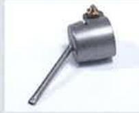
Lötdüse Ø 3 x 1,5 mm, Oval Artikel-Nr.: 107.148