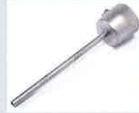
Verlängerungsdüse Ø 5 x 130 mm, gerade Artikel-Nr.: 107.006