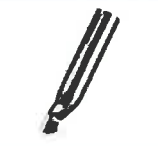
Tacking nozzle * Article No: 106.996