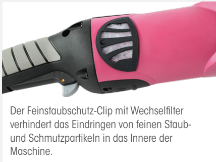
Der Feinstaubschutz-Clip mit Wechselnfilter verhindert das Eindringen von feinen Staub- und Schmutzpartikeln in das Innere der Maschine.